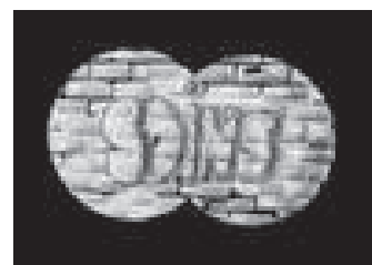
Accès aux soins