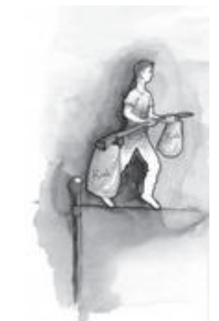
Les consommations à risque