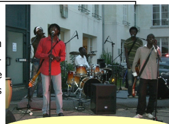
Le groupe Pyramides

La suite du programme était particulièrement chargée puisque trois groupes étaient invités à jouer dans la cour. LXir a débuté par une session slam remplie d'accents les plus subtils.