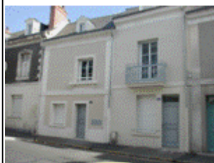
Résidence FJT de la Riche