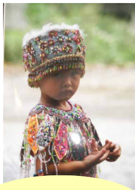
Exposition photo de Jean François Peretti sur le thème de la chine