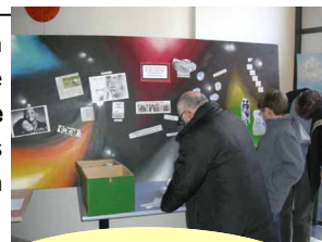
Création du mur d'images le 20 décembre dernier

Les résidents du FJT ont, quant à eux, réalisé un graff ayant pour thème la citoyenneté. Les travaux sont exposés dans la salle de sport de l'association.