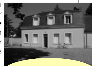
Résidence FJT hôte St Vincent, Joué les Tours