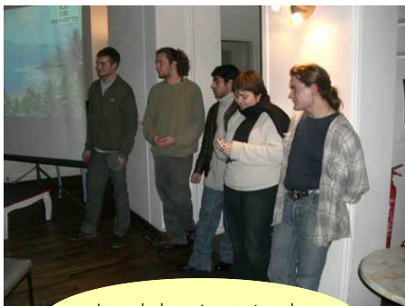
Lors de la présentation du film au FJT