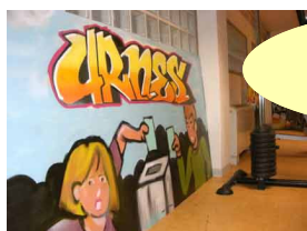
Graff réalisé par les résidents

Retour sur le Projet Citoyenneté au FJT: Le 20 décembre dernier, encadrés par des étudiants en Carrières Sociales de l'IUT de Tours, un Mur d'Images sur le thème de la citoyenneté a été créé. Les adhérents de l'association ont été sollicités pour amener « une photo, un article, une image ou une citation » en lien avec leur propre perception de la citoyenneté. Au total, nous notons une centaine de participants. Cette action a également permis d'entamer le débat en cette période électorale.