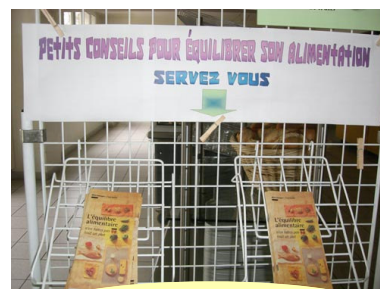
Repas « léger »

Au mois de janvier, une artiste peintre est venue exposer ses œuvres au restaurant. Pour le nouvel an chinois, M. Perreti, partenaire de l'association France - Chine Touraine, nous a prêté ses photos de 3 minorités du sud est de la Chine. Un repas chinois était également servi. Fin février, les adhérents ont pu déguster un repas « léger », une documentation sur l'équilibre alimentaire est également à la disposition des adhérents pour les aider dans leurs choix alimentaires.