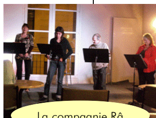
La compagnie Râ

Les résidents ne s'y trompent pas, la qualité est au rendez vous, et c'est avec enthousiasme que chacun écoute, regarde, rit... La compagnie sait rendre accessible le théâtre parfois considéré comme éloigné des jeunes. En les rencontrant directement dans leur lieu de résidence, au FJT, ils tendent à supprimer cette distance.