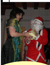
Le passage du Père Noël

La soirée de Noël des résidents, organisée cette année le 20 décembre a permis de clôturer 2007 dans la bonne humeur. Cette fête fut exceptionnelle avec la participation record des jeunes comme des salariés. Ce moment privilégié permet de réunir autour d'une table, les salariés, les résidents, et les administrateurs ; c'est un rituel important pour chacun des membres de l'association.